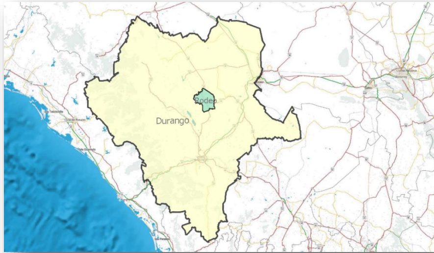
Imagen 1. Mapa de la ubicación del Municipio de Rodeo en el Estado de Durango.